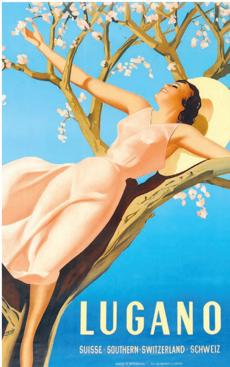
Gino Boccasile, Lugano, 1939, Farblithografie, 101 × 64 cm.

Oben rechts: Emil Cardinaux, Jungfrau-Bahn, 1910, Farblithografie, 101 × 72 cm. Im Hintergrund ist die dominante Bergkette mit Jungfrau, Mönch und Eiger zu sehen und im Vordergrund eine Seilschaft auf dem ewigen Eis.