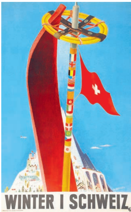
Alois Carigiet, Winter/Schweiz, 1937, Farblithografie, 102 × 64 cm.

Die Schweizer Fahne hebt sich selbstbewusst von den anderen auf dem Skistock ab. Im Hintergrund finden sich viele werbewirksame Schweizer Symbole.